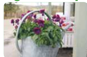
En blomstande landsbygd